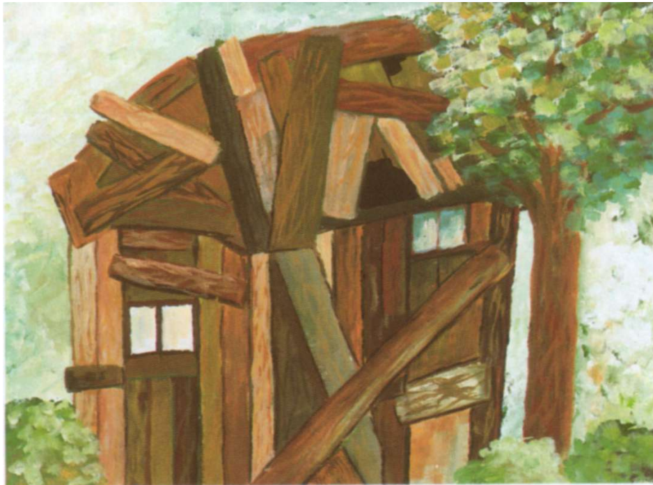
Bude aus alten Brettern, 6. Schj.