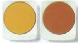
80 Ockergelb 190 Gebr. Siena

Diese beiden Erdfarben sind im neuen Norm-Kasten DIN 5023 enthalten. Darüber hinaus läßt sich eine Vielzahl von Braunvarianten ermischen. Hier nur einige Beispiele.