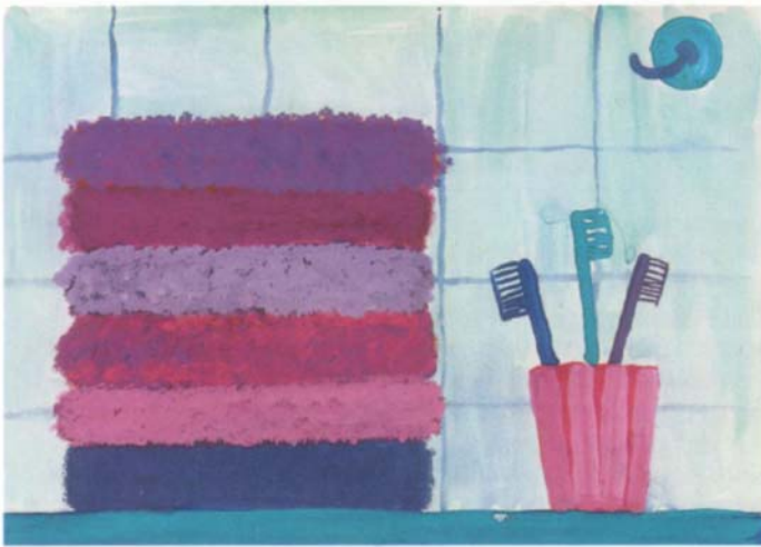
Im Badezimmer, 6. Schj.