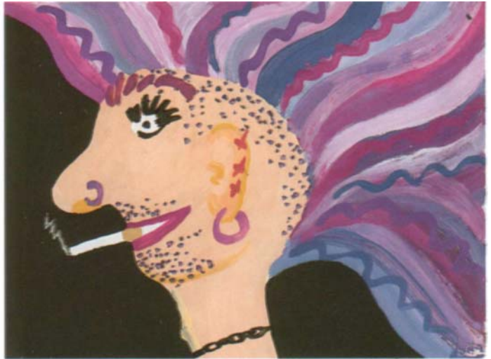
Punker, 6. Schj.