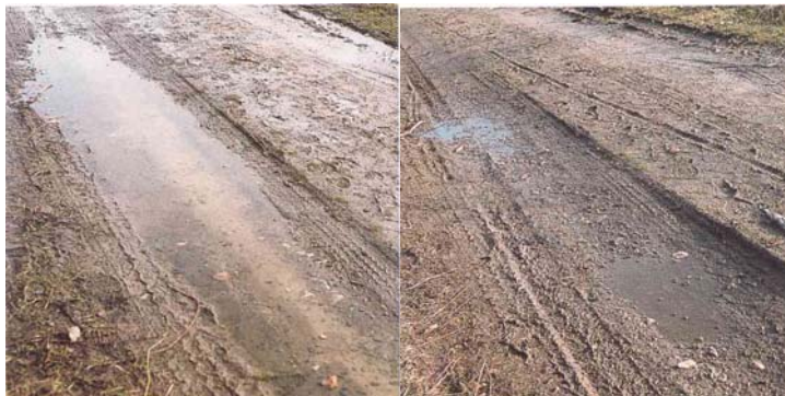
Feldweg direkt nach einem Regen